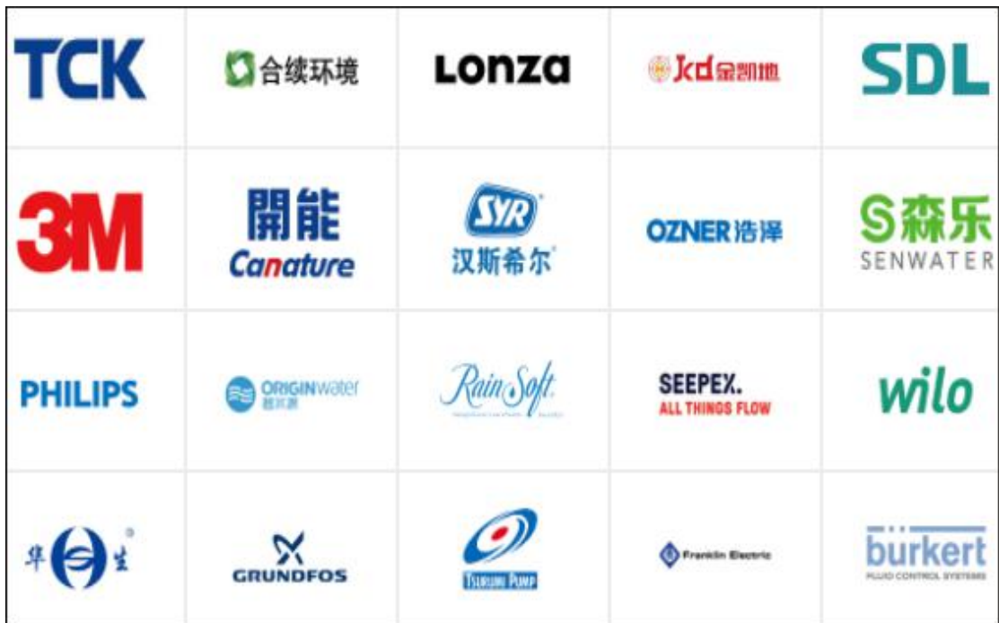
部分参展品牌预览

具体而言,主办方打破常规展会的单一产品展示形式,联手 ImagineH 2 O、ISLE、Bluetech、迈科技等多家国际权威环保创新机构,构建互动体验功能区“高新技术与优质工程演示区”。据了解,演示区内,优选上万个全球年度顶尖行业技术及上千项环保工程/工艺解决方案于现场展示,并配有资深技术人员提供现场讲解、技术咨询、成果转化、政策解读等多项服务。