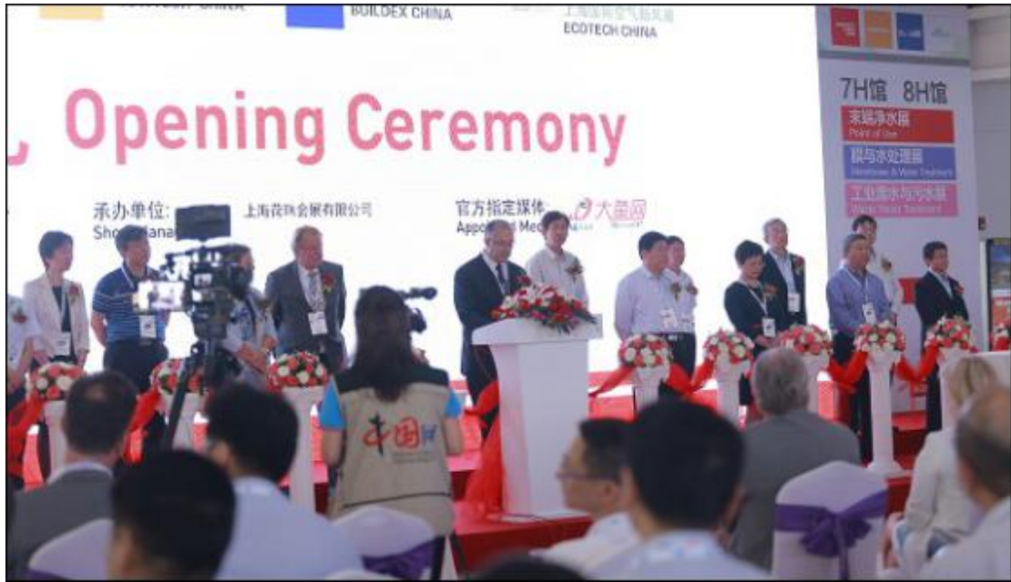
上届世环会开幕盛况

高、大、全： 展览面积达 22 万平方米，来自 15 个国家和地区的 3400 家全球环保企业将盛装亮相，国际化品牌逾 50%；5 大主题展（上海国际水展、上海国际泵管阀展、上海国际建筑水展、上海国际固·废气展、上海国际空气新风展），24 个细分主题展示区，涵盖环保全业态垂直板块。